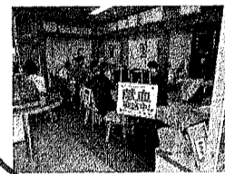
公衆衛生推進協議会