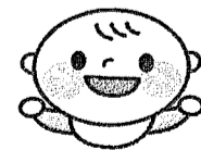
井口台地区民児協 鈴が峰公民館

よく晴れた5月21日(日)7回目の「ちびっこ運動会」が鈴が峰公民館で行われました。集まった親子は36世帯121人。はいはいで、パパママ目指してまっくら、中には落ち着いたままの子も。音楽に合わせて、好きな道具で遊んだり、大きなおむすびを転がしたりして楽しそうでした。最後に金メダルを首に掛けてもらい、おみやげをもらってバイバイ。短い時間の中に、ほほえましい光景がいっぱいの運動会でした。